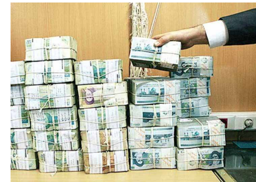
نرخ بهره سپرده‌گذاری نزد بانک مرکزی به ۱۳ درصد افزایش یافت