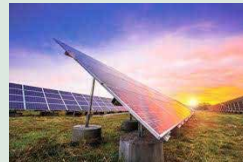
مدیرعامل شرکت توزیع نیروی برق استان کردستان:

توزیع نیروی برق استان کردستان در ادامه بیان کرد: هنوز در اوایل راه قرار داریم و اگر بتوانیم از این انرژی به نفع احسن استفاده کنیم دیگر نیازی نیست نگران به اتمام رسیدن ذخایر نفت، زغال سنگ و گاز طبیعی کشورمان باشیم. لهنویان در ادامه با اشاره به بخشنامه ابلاغی دولت در سال ۹۴، عنوان کرد: ادارات و ارگانها مکلف هستند ۲۰ درصد انرژی مورد نیاز خود را از طریق انرژی های تجدیدپذیر به ویژه سامانه های خورشیدی تأمین کنند. وی ذکر کرد: تغییرات ارز در یکی دو سال اخیر به ویژه برای خرید تجهیزات، کمبود بودجه ادارات و ارگانها، دسترسی آسان به برق دولتی و نرخ انرژی پایین آن در مقایسه با انرژی های تجدید پذیر از جمله خورشیدی، دلایل موجود برای عدم تحقق صد درصدی اجرای این بخشنامه می توان ذکر کرد. مدیرعامل شرکت توزیع نیروی برق استان کردستان در بخش دیگری از سخنان خود گفت: کردستان از ظرفیت های لازم برای ایجاد و توسعه تولید انرژی از طریق نور خورشید برخوردار است و در صورت ایجاد بسترهای لازم سرمایه گذاران برای سرمایه گذاری در این زمینه در استان تمایل خواهند داشت. وی خاطرنشان کرد: تابش نور خورشید و هوای معتدل مناسب، با توجه به شرایط جغرافیایی استان کردستان (میانگین تابش نور خورشید در روز برابر ۵ الی ۶ ساعت و در سال برابر ۱۸۲۵ الی ۲۱۹۰ ساعت است)، افزایش بهای خرید توسط سازمان انرژی های تجدیدپذیر و بهره وری ایران (ساتبا) برای سال ۹۹ و خرید برق تضمینی ۲۰ ساله، توسط ساتبا از دلایل تمایل سرمایه گذاران در استان در این زمینه است. لازم به ذکر است تا کنون ۱۹ درخواست برای دریافت مجوز در این خصوص ارائه شده و با ۱۶ مورد طبق نقاط اولویت دار از طرف شرکت توزیع نیروی برق کردستان موافقت انجام شده است.