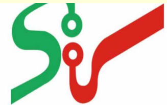
سامانه تدارکات الکترونیکی دولت

طی سال‌های گذشته، به تدریج تعداد عوامل بخش خصوصی اعم از اشخاص حقیقی و حقوقی (خریداران و فروشندگان از جمله تامین کنندگان، مناقصه‌گران و مزایده‌گران) که در سامانه فعال