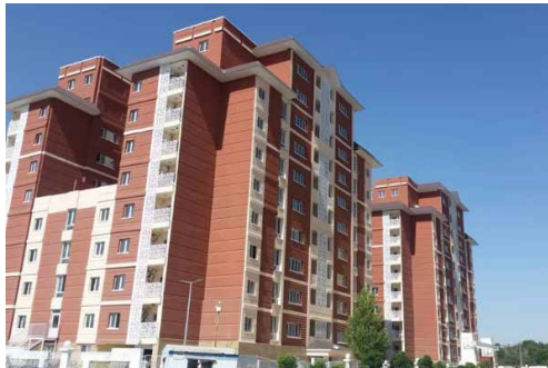
یک مقام بانکی خبر داد

وی افزود: در این راستا اگر سازمان برنامه و بودجه بتواند بخشی از هزینه‌های یارانه تسهیلات پیش بینی شده برای این حوزه را به بانک پرداخت کند، بانک نیز می‌تواند نقش بیشتری در حوزه تأمین مالی این طرح با استفاده از ابزارهای نوین تأمین مالی را داشته باشد.