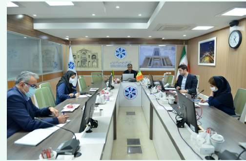
دروبینار توسعه همکاری‌های ایران-داکار در اتاق بازرگانی تهران مطرح شد