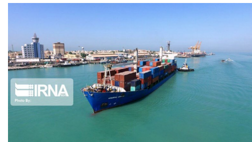
معاون وزیر صنعت: