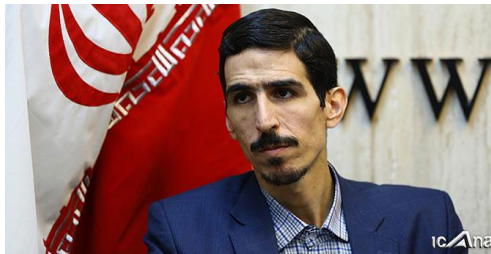
شریعتی انتقاد کرد:

سخنگوی کمیسیون انرژی مجلس شورای اسلامی بیان کرد: به نظر می‌رسد مشکل از سمت مجموعه وزارت نفت است که نمی‌تواند گاز نیروگاه‌ها را تامین کند لذا بررسی این موضوع در دستور کار مجلس قرار گرفته است.