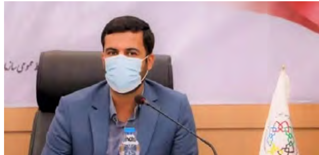
معاون وزیر صمت در گفتگو با مهر:

رئیس سازمان توسعه تجارت ایران افزود: به عنوان مثال اگر ما با ترکیه تعرفه ترجیحی داشته باشیم